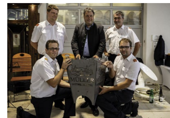
Die Spenden der Festgäste wurden der FF Krustetten für eine neue Waldbrandausrüstung übergeben.