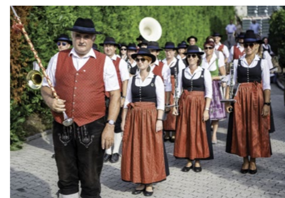
Die Musikkapelle Paudorf umrahmte die Festeröffnung!